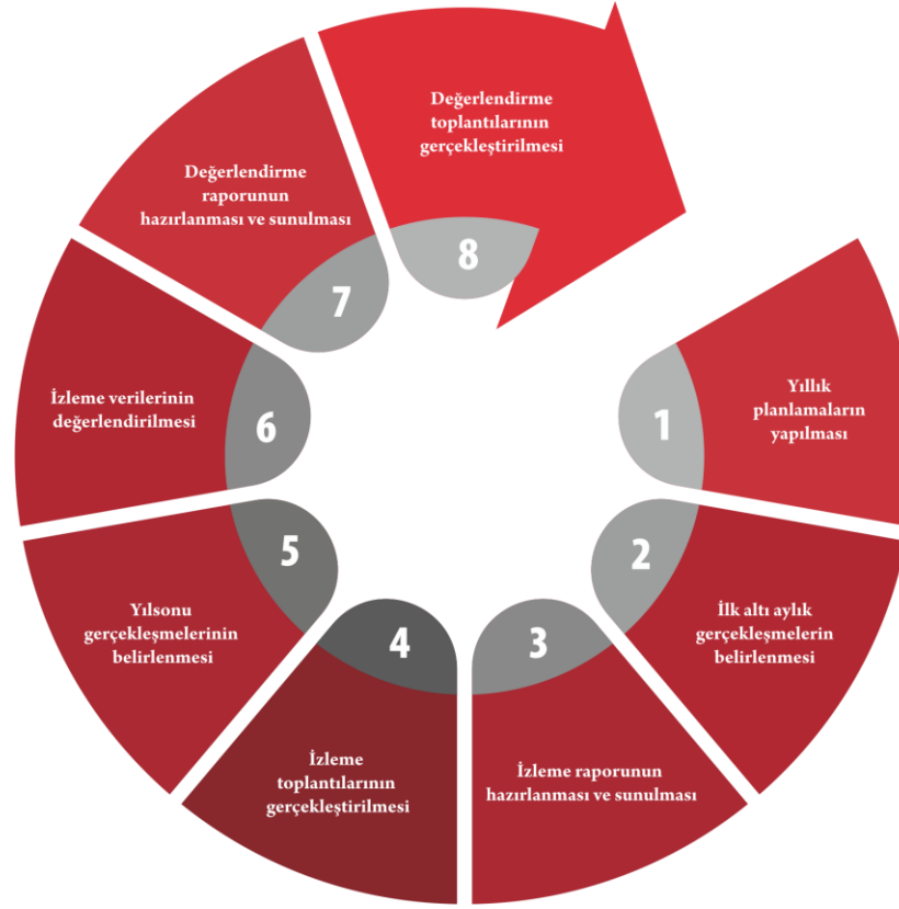
Şekil 2. İzleme Değerlendirme Süreci

Şerafettin Tunalı İlkokulu 2024-2028 Stratejik Plan'ının izleme ve değerlendirme süreci ve takvimi Şekil 2 'de ifade edilmiştir.